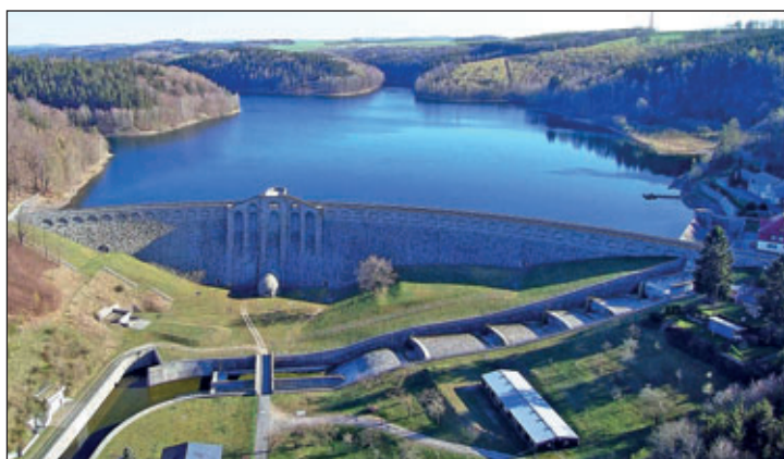
Talsperre Klingenberg

Die Täler sollten nicht einfach abgeriegelt werden, sondern zugleich einem ästhetischen Anspruch genügen. In Klingenberg übertrug man dem renommierten Architekten und Universalkünstler Hans Pölzig den Entwurf. Beide Schwerkraftmauern sollten eher an einen natürlichen Felsen als an eine Staumauer erinnern. Ein Argument für die herausragenden Steine, jeweils an der Luftseite der Staumauern. Dort wo sich das Gestein unserer Erde in den Blick eines Betrachters drängt, wie am Porphyrfächer in Mohorn, den Sandsteinformationen in der Seifersdorfer Heide oder den Felsen in der Klingenberger Schweiz, spricht man von einem Geotop. So wirken unsere 2 Talsperren im entstehenden Geopark „Sachsens Mitte“ heute wie künstliche Geotope.