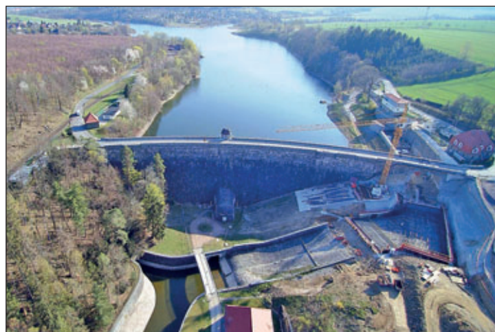
Talsperre Malter

Natürlich wurden sie umgehend zu Wanderzielen und damit in das bereits damals markierte Wanderwegenetz eingebunden. Der grüne Strich, der als Markierung über beide Talsperrenmauern führt, gehört zu einem großen Rundwanderweg durch den Tharandter Wald bis ins Döhlener Becken und über den Poisenwald und die Dippoldiswalder Heide wieder zu den Talsperren. Der viel später aufgelegte Energielehrpfad der ENSO verbindet beide Talsperren und ist ein nicht ganz so großer Rundwanderweg mit Erlebnispotenzial. Rundwanderwege z.B. um die beiden Talsperren, auch in Schmiedeberg, Glashütte, Ammeldorf oder das GEORADO-Zentrum in Dorfhain sind immer gute Optionen zwischen 5 und 20 km Länge für Tagestouren, ohne dass man zwingend auf einen guten öffentlichen Personennahverkehr angewiesen ist.