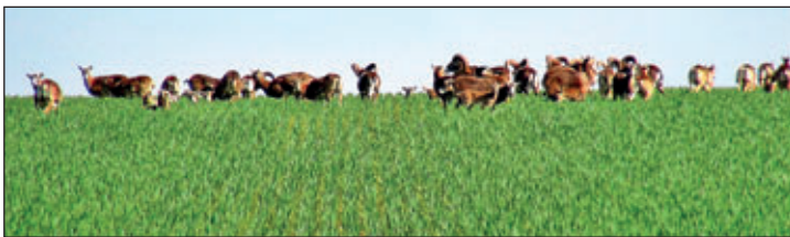
Muffelwild mit Nachwuchs Mai 2020

Alles das gibt es in unserer reizvollen Landschaft. Auf dem Weg zum nationalen Geopark „Sachsens Mitte“, der den Tourismus fördern soll, kann es folglich nicht darum gehen Anwohner, Gäste und Touristen von unseren reichhaltigen Naturerlebnissen und Schutzgebieten fern zu halten. Es geht eher darum, die Lenkungsfunktionen verschiedenster heutiger Interessengruppen, über Wege, Pfade und Steige, sinnvoll auszuschöpfen.