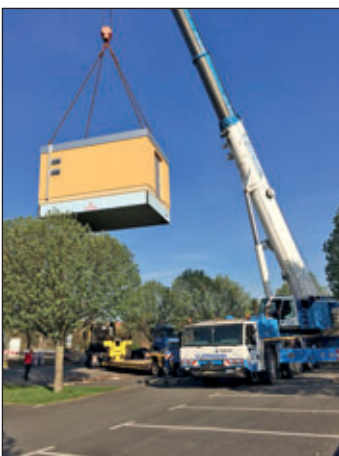
POP Aufbau am 26.5.2020