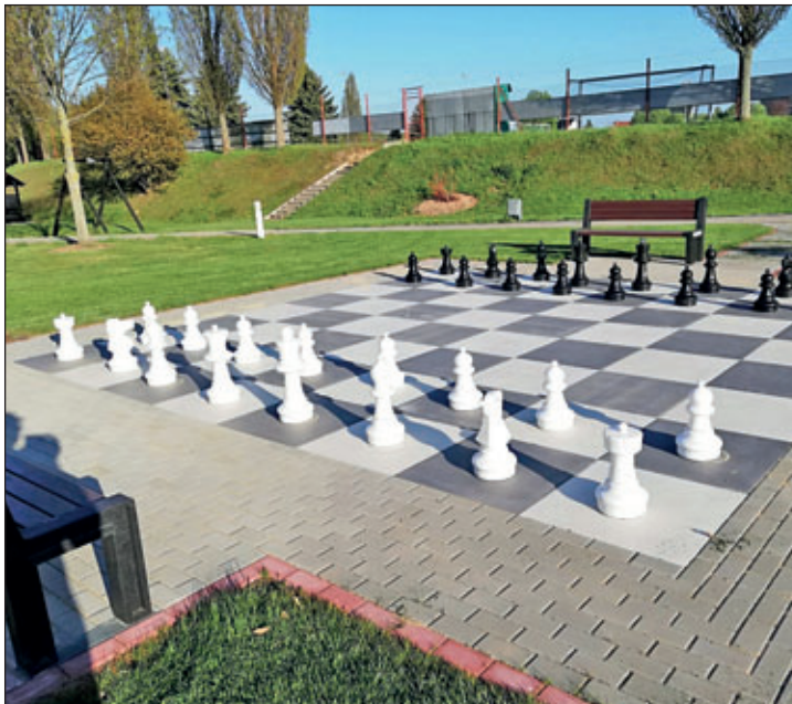
Mit dem Fördermittelprogramm „Lieblingsplätze für Alle“ verfügt das Erlebnisbad Dorfhain über einen zusätzlich und liebenswert gestalteten Denk-Sport-Bereich.