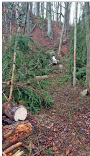
Naturerlebnis Edle Krone: ... der Wandersteig am Lorenzsteig zum „Annaplatz“, zwischen Höckenbach und Heiligem Weg, ist auf eigene Gefahr wieder begehbar.

Spricht man vom „Betretungsrecht“, dann bleibt ein „Befahren“ mit modernen Sportgeräten, abseits von ausgewiesenen Wegen, auf Stiegen,