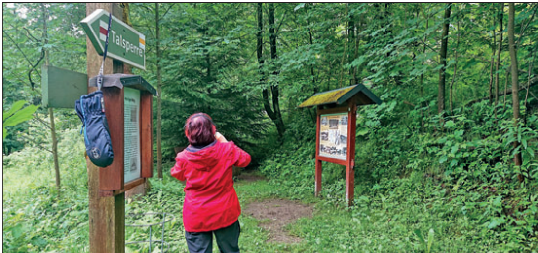
Bestandsaufnahme und Sichtung des Reparaturbedarfes am Trinkwasserlehrpfad Wilde Weißeritz, im Juni 2021

zu kommen in heutigen Tagen Trendsportarten wie Geocaching, also eine Art elektronische Schnitzeljagd mit Mobiltelefon oder GPS Empfänger, zunehmend Mountain-Biker mit oder ohne Elektrounterstützung die abwechslungsreiche schwierige Wanderpfade aussuchen, damit solch ein „Trail“ nicht langweilig wird und immer wieder neue Herausforderungen bietet. Und so nehmen Konflikte zwischen Interessengruppen weiter zu. Darf also einfach jeder Tun und Lassen was er will? Die Lösung liegt in einem fairen und toleranten Umgang miteinander oder in Regeln und Angeboten, die in der Kommunalpolitik diskutiert, sowie breit, regel-