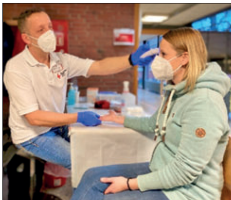
DRK-Blutspende unter Pandemiebedingungen. Hier: Messung des HB-Wertes vor der Blutentnahme; Foto: ©DRK-Blutspendedienst; Nutzung honorarfrei

rem genau, was mit dem Spenderblut nach der Blutspende passiert oder können selbst Themen vorschlagen.