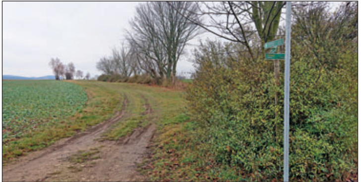
Eisenpfahl neben Wanderwegweiser? Hier am alten Bimmelbahndamm zwischen Friedersdorf und Pretzschendorf.

Fast wie Spargelstangen wachsen derzeit verbreitet Eisenpfähle neben Wegweisern aus der Erde, wie im Bild am Bimmelbahndamm in Pretzschendorf, um die Talsperre Klingenberg zu beobachten. Hier entsteht die neue Ausweisung eines Radverkehrskonzeptes, so die Antwort auf Nachfrage in den Kommunalverwaltungen. Am Ende wohl weniger für Straßenradsporthler geeignet, sondern eher für Tourenradler und Moutainbiker. Denn Wanderer lieben unversiegelte Wege und Radler suchen möglichst glatten Untergrund ohne Sturzgefahren in ausgefahrenen matschigen Fahrspuren. Unserer Trail-Radler einmal ausgenommen.