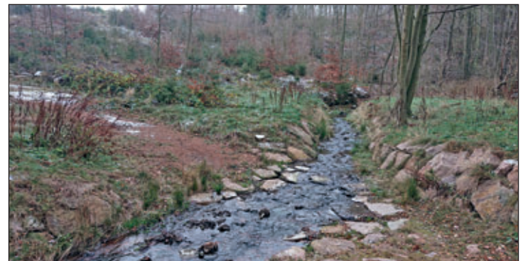
Der Wanderweg über Trittsteine durch den Ochsenbach bei Schmiedeberg – eine interessante Option.