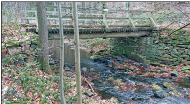
Die Knackerbrücke neben dem Wanderrastplatz an der früheren Lehnmühle, sollte nicht einfach abgerissen werden.

Ihr Gunter Fichte Kreiswanderwegewart Betreuungsgebiet 3