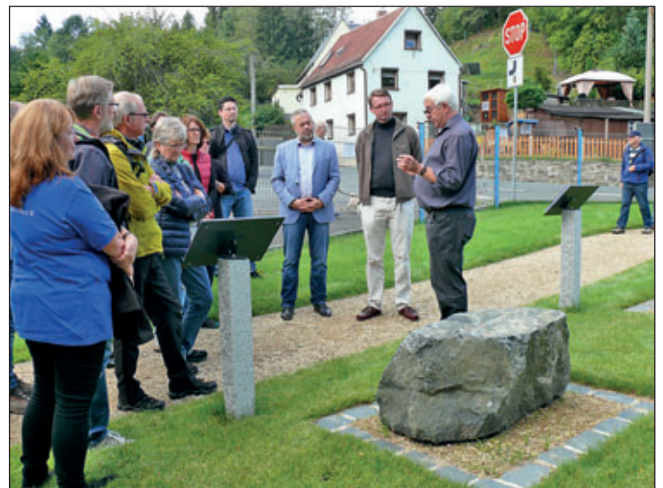
Pfad der Gesteine – Eröffnung im Rahmen des Geopark Tharandter Wald