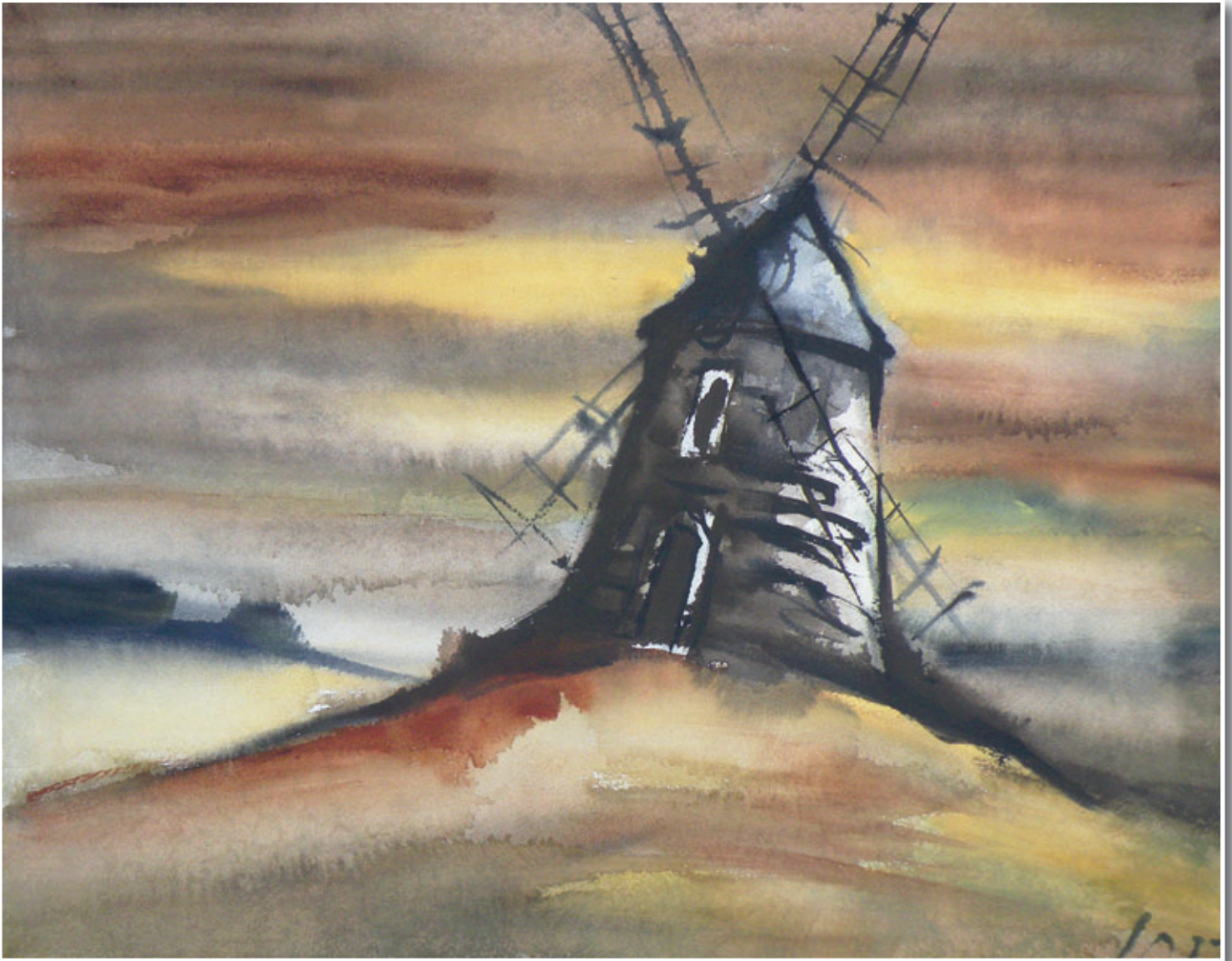
„Die Dorfhainer Windmühle“ (1870 bis 1895)

Impressum: Herausgeber: Gemeinde Dorfhain, 01738 Dorfhain, Schulstraße 4, Telefon 035055/61833, Fax 035055/61651, E-Mail gemeinde@dorfhain.de • Druck: RiEDEL GmbH & Co. KG – Verlag für Kommunal- und Bürgerzeitungen Mitteldeutschland, Gottfried-Schenker-Straße 1, 09244 Lichtenau/OT Ottendorf, Telefon 037208/876-0, Fax 037208/876299, E-Mail info@riedel-verlag.de , www.riedel-verlag.de