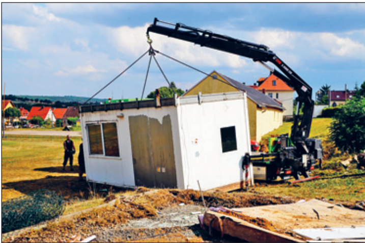
Wieland Saupe, Gemeinderat Dorfhain / Vorstand Dorfhainer SV im Namen aller Beteiligten

ein, einzig die längst bewilligten Fördermittel von rund 900.000 € bei 100.000 € Eigenmitteln wurden pünktlich ins neue Jahr übertragen. Mit dem Bau der Chlorgasanlage im Erlebnisbad wurde Teil 1 des Projektes umgesetzt und damit der Startschuss für die Unumkehrbarkeit des Projektes gesetzt. Zunächst mussten schweren Herzens die Bäckercontainer abgetragen, Bäume gefällt und Medien umgelegt werden, um Baufreiheit zu schaffen. Den Zuschlag erhielt nach der Ausschreibung die Firma HABAU aus Wilsdruff, sodass der Baustart noch im August 2024 beginnen konnte. Noch vor dem Winter soll der Rohbau möglichst fertig sein, sodass der Innenausbau mit allen Gewerken zügig vorangehen kann. Nach Plan soll der Bau Mitte 2025 fertig sein. Das neue Sport- und Freizeitzentrum Dorfhain umfasst zukünftig ca. 450 Quadratmeter. Das neue Freisportgebäude umfasst zukünftig 4 moderne Umkleidekabinen mit separaten Dusch- und Sanitäranlagen, 2 Schiedsrichterstuben und einem großen Versammlungsraum mit Teeküche. Energetisch wird das Haus mit einer Gasheizung und kombinierten Solar-Panels zur unterstützenden Warmwasseraufbereitung versorgt. Ein großer Freisitz sowie die Option zur Erweiterung, um einen späteren Anbau sind im Projekt ebenso inbegriffen. Auf gutes Gelingen!!