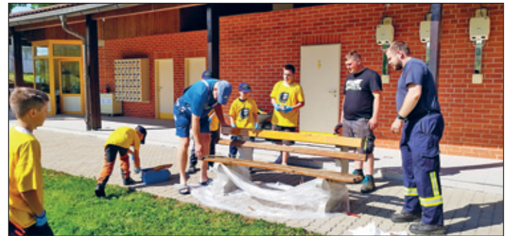
Das Team der Jugendfeuerwehr Dorfhain

Eigentlich viel zu tun, aber bei insgesamt ca. 40 Helfern doch schneller erledigt als gedacht. Und so sammelten wir alle Kinder nach getaner Arbeit ein und vertrieben uns im Erlebnisbad die Zeit, bis das Mittagessen angerichtet war. Danke an die Frauenabteilung der Feuerwehr Dorfhain, die uns lecker Currywurst und Wiener zubereitet haben. Gesättigt und glücklich über das Erreichte, konnten wir unsere Kinder und Jugendlichen gegen 13:30 Uhr nach Hause entlassen. Wir sind uns sicher, dass unser Nachwuchs das Geschaffene achtet und am Erhalt interessiert ist, denn sie schätzen den Wert nun anders. Wir bedanken uns für das ausgezeichnete Miteinander mit den „Natur- und Heimatfreunden Dorfhain e.V.“, mit denen wir von Beginn unserer Teilnahme an den 48h-Aktionen perfekt zusammenarbeiten. Bedanken möchten wir uns ebenfalls bei den zahlreichen Sponsoren und Unterstützern, die diese Aktionen mit den unterschiedlichsten Inhalten gefördert haben. Wir freuen uns schon auf die nächste Aktion – eine Idee gibt es bereits.