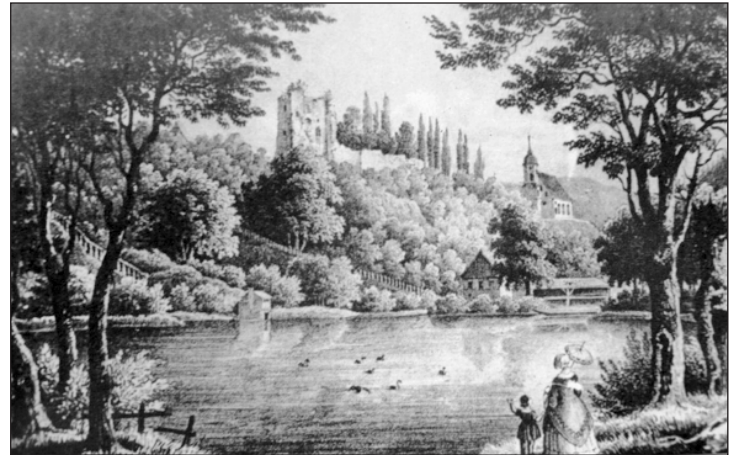
Blick über den Schlosssteich ... um 1818 - Adrian Ludwig Richter (1803 -1884) Zeichnung

Rundwanderung am 7. Juli 2024 , auf dem "Tharandter Malerweg". Zahlreiche Künstler der Romantik besuchten zwischen 1780 und 1840 Tharandt und hinterließen wunderschöne Bilder. Diese wollen wir mit den jetzigen Ausblicken betrachten. Neben dem Blick über den Schlosssteich geht es durch die Heiligen Hallen zum Heinrichs Eck, weiter zum Königsplatz und auf den Burgberg mit einer Sicht in die drei Täler. Die Wandertour ist vom Höhenprofil her anspruchsvoll und beträgt ca. 6 km.