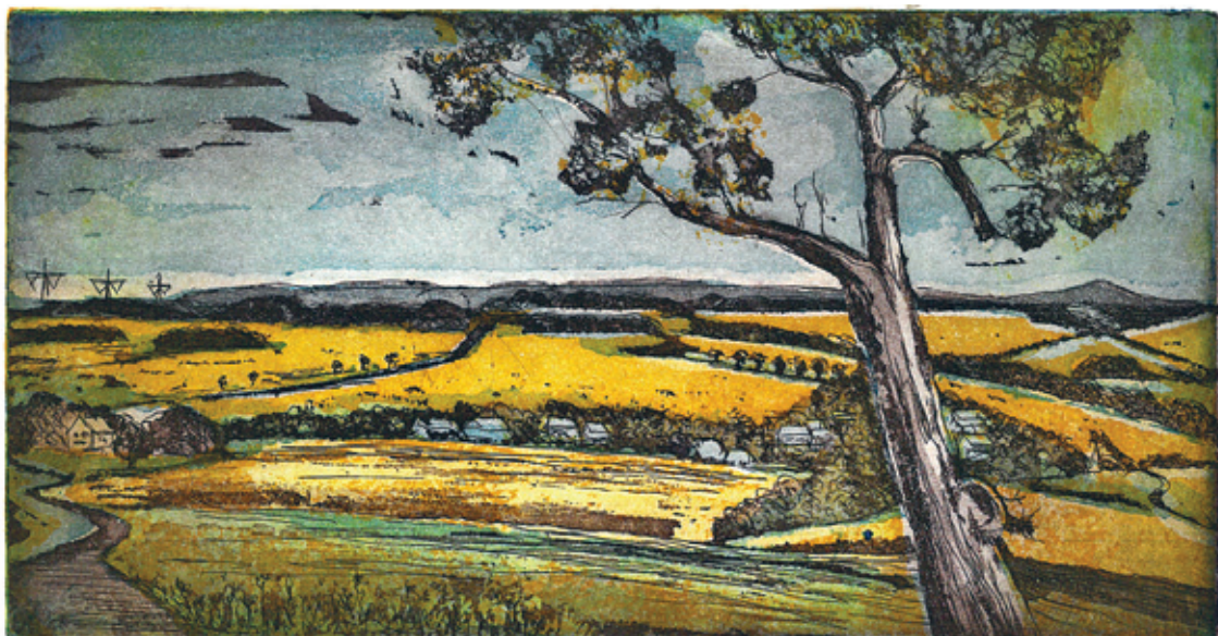
Blick von der Neuklingenberger Höhe (25 x 13 cm)

zum Thema „Entlang der Weißeritz, vom Osterzgebirge bis Dresden“. Radierung von Karl-Heinz Haberkorn