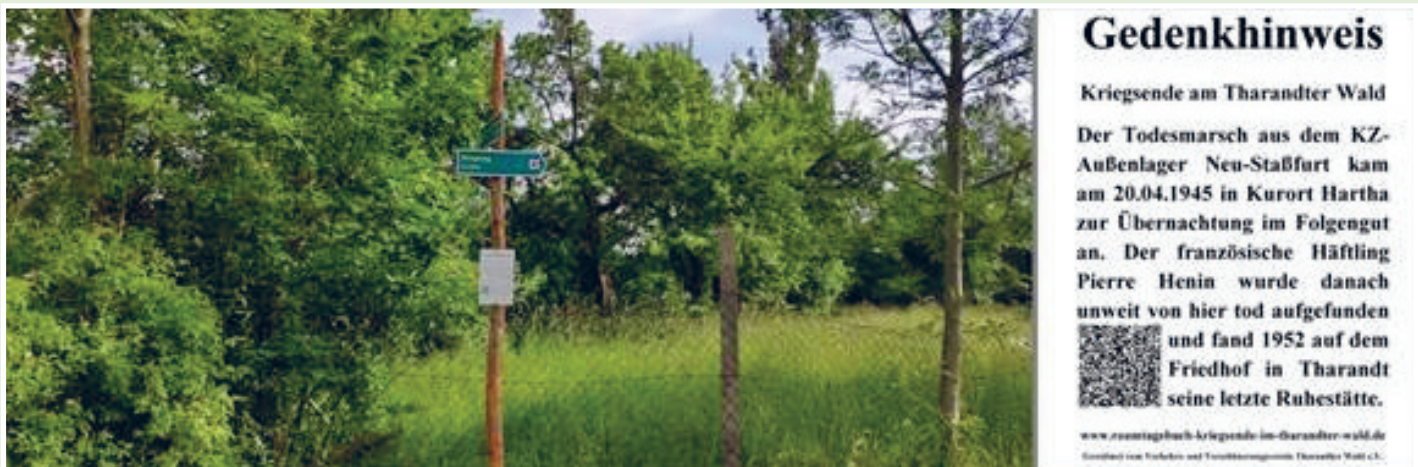
Unter einem Wegweiser angebrachter Gedenkinweis beim Folgentut in Kurort Hartha mit Inhalt des Schildes rechts.