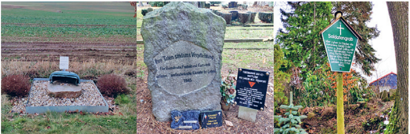
Panzerdenkmal zwischen Pohrsdorf und Herzogswalde. 2020. III Gedenkstein und -tafeln für Opfer des Todesmärsche auf dem Friedhof Tharandt. 2020. III Soldatengrab unterhalb des Landbergs. 2023.

Die Thematik des Kriegsendes im Tharandter Wald war bisher nur durch Gräber und einzelne Erinnerungszeichen präsent. Dazu gehören das in privater Initiative geschaffene Panzerdenkmal zwischen Pohrsdorf und Herzogswalde, die Gräber und Gedenkzeichen für Opfer der Todesmärsche in Fördergersdorf, Herzogswalde und Tharandt, das Grab der sechs Hitlerjungen im Wald bei Kurort Hartha sowie die auf verschiedenen Friedhöfen und im Wald liegenden Gräber deutscher Soldaten, die in den letzten Kriegstagen gefallen sind.