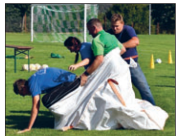
Spaßwettkämpfe der Vereine – Kaninchenzüchter in Aktion