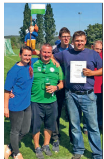
... und Sieger im Wettbewerb 2023