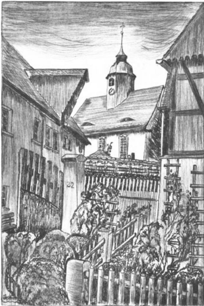
„Dorfhainer Kirche“ (20 x 30 cm)

Radierungen von Karl-Heinz Haberkorn zum Thema „Entlang der Weißeritz, vom Osterzgebirge bis Dresden“.