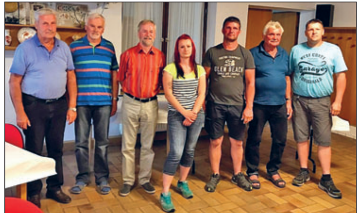
Einige Züchter des Vereins zur Jahreshauptversammlung 2022