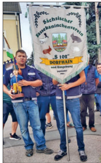
Einmarsch zum Dorffest 2023