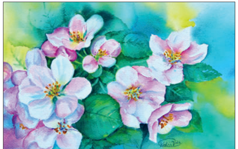
Apfelblüten 20 x 30 cm