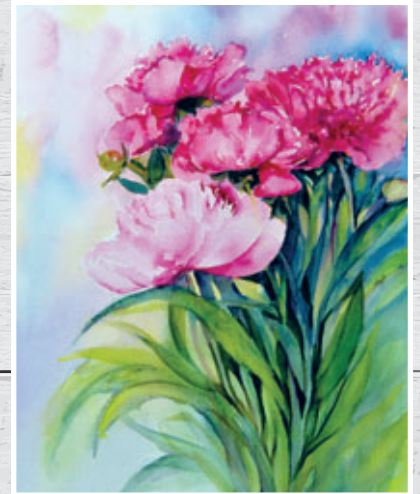
Pfingstrosen 40 x 50 cm