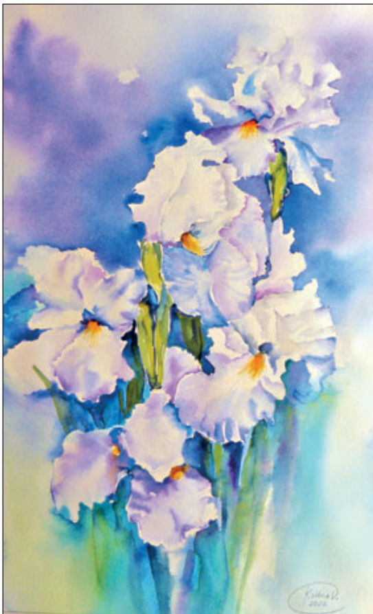
Iris 50 x 70 cm