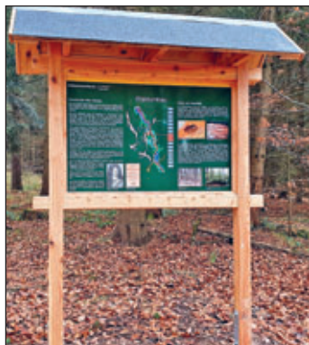
Lehrtafel Sachsenforst Thema Waldumbau am Trinkwasserlehrpfad Wilde Weißeritz

Die Umsetzung der Ideen erfolgen mit Fördergeldern beziehungsweise über Sponsoren. Diese haben die Themen vorher beraten, Fördermittel beantragt und schließlich Lehrtafeln dazu aufgestellt. Im Mobilfunkzeitalter sind diese Tafeln immer häufiger mit einer Marke versehen die QR-Code genannt wird. Wie beim Einkaufen in größeren Märkten fotografiert man diese Marke mit dem Mobilfunktelefon und einer „App“ (Application) und wird im Internet zu zusätzlichen Informationen oder sogar zu Abenteuerspielen weiter geleitet. Wer