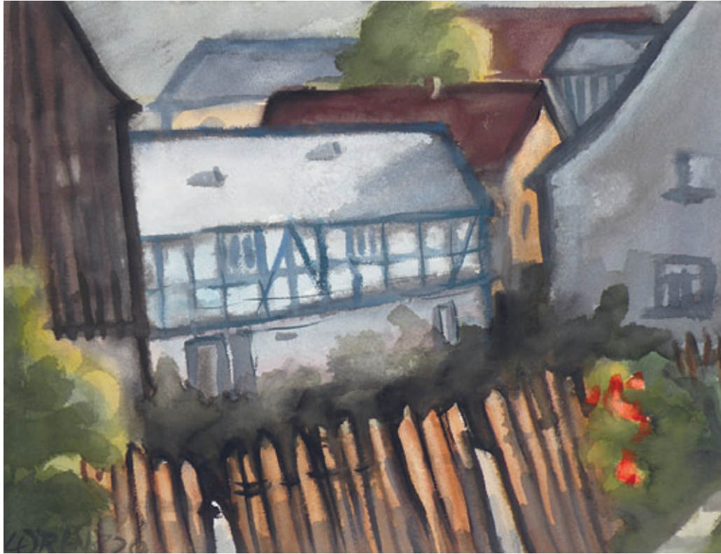
Bäuerliches Gehöft 60 x 46 cm