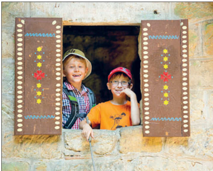
Entdeckertour im GEOPARK Sachsens Mitte

Beim Wandern mit Kindern ist vor allem Abwechslung gefragt – ideal sind altersgerechte Touren mit interaktiven Spielstationen am Wegesrand und einem interessanten Ziel. In Grillenburg gibt es gleich drei Erlebnispfade, die der ganzen Familie Spaß machen. Zum „Holzweg“, gelangt man vom Parkplatz am Triebischweg. Entlang des Bachlaufes sind verschiedene Holzsortimente und ihre Verwendung sowie typische Holzeigenschaften und Holzprodukte anschaulich dargestellt. Der „Abenteuerpfad“ verläuft im Tal der Triebisch. Schatzinsel, Blockhaus und andere Attraktionen laden zu fantasievollem Spiel ein. Am Ende des Pfades bietet ein Picknickplatz an der Wegkreuzung „Gründer Weg / Triebischweg“ Zeit für eine Rast. Der „Sinnespfad“ spricht alle sechs Sinne des Besuchers an. Auf ihm kann man den Wald sehen, hören, riechen, schmecken, ertasten und seinen Gleichgewichtssinn testen. Vom Aussichtsturm aus kann man mit etwas Glück und Geduld im benachbarten Gehege Wild entdecken.