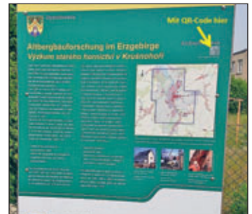
Lehrpfad Dippoldiswalde mit QR-Code

heimisches Muffelwild. Eine kostengünstige Werbung für jegliche Lehrpfade unserer Region bieten Plattformen wie Wikipedia, die Webseite unseres GEOPARK Sachsens Mitte, der Landschaftspflegeverband im Osterzgebirge oder das Landesamt für Umwelt, Landwirtschaft und Geologie.