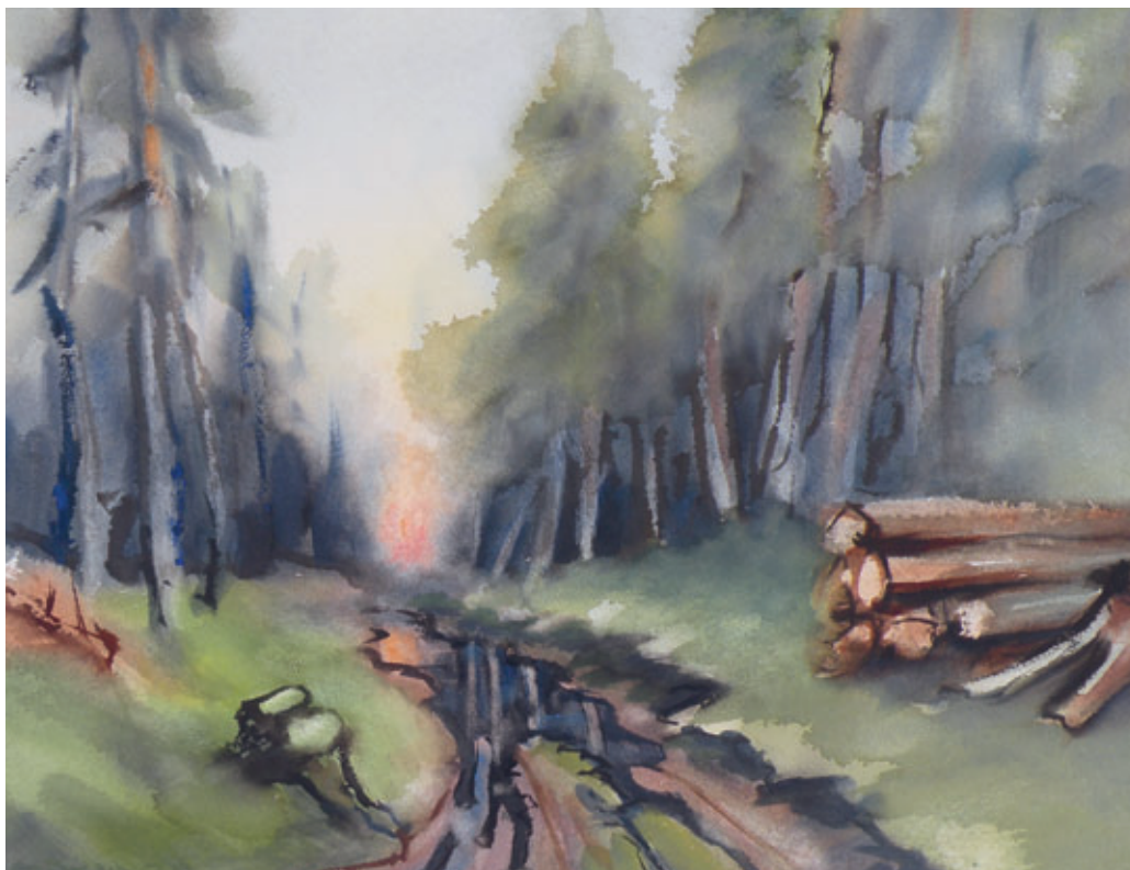
Tharandter Wald nach dem Gewitter 60 x 47 cm