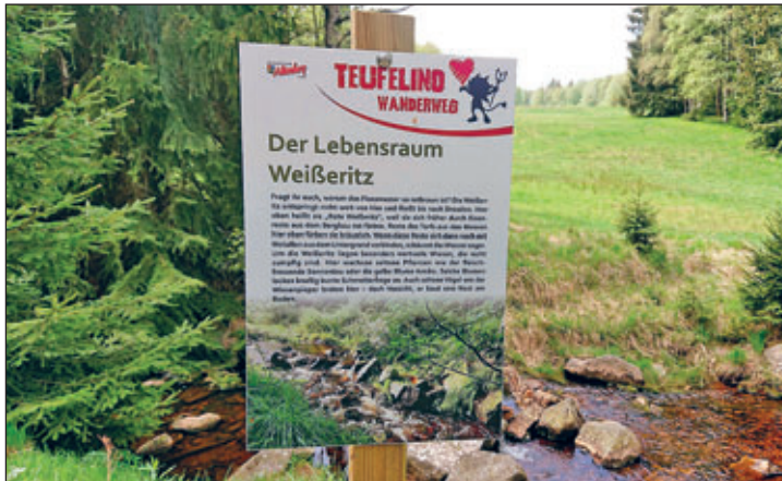
An der Roten Weißeritz bei Schellerhau

Unsere Wanderheimat – Osterzgebirge hat viele gute Beispiele als Antwort auf diese Fragen. Doch es gibt noch Anlass für Verbesserungen. Auf dem 11. sächsische Wandertag im vogtländischen Plauen, am 20. Mai dieses Jahres, wurde vom Vertreter des Deutschen Wanderverbandes aktuell zum Thema der Leitfunktion von Wanderwegen referiert. Es wurde erneut deutlich, wie durch markierte Wanderwege das allgemeine Betretungsrecht der Bürger kanalisiert und die Wanderlust bedarfsgerecht und anspruchsvoll gelenkt werden kann.