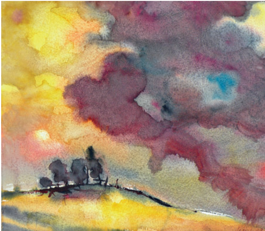
Windmühlenberg 52 x 46 cm