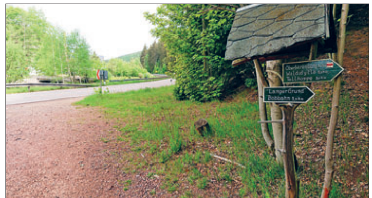
Eingang langer Grund an der B170 in Schmiedeberg, aber wohin geht man wenn dieser Ort der Ausgang ist? Wo ist ein Wanderanschluss, oder der Bahnhof? Foto GF 22

Laune Brücke in Schellerhau, die Geschichten am grenzüberschreitenden Wanderweg zwischen Rehefeld und dem böhmischen Moldava , vielfältige Naturlehrpfade wie um den Geisingberg oder zwischen Tharandt, Edle Krone und dem Geoparkzentrum „Sachsens Mitte“ in Dorfhain, werden zu reizvollen Tageserlebnissen. Ganz neu aufgelegt und sehr zu empfehlen der Wanderführer Schlottwitz und Umgebung im Müglitztal. Wenn man als Ortswegewart oder Heimatverein seine Initiativen mit den Augen eines ortsunkundigen Wanderers betrachtet, fallen hier und da doch Unzulänglichkeiten auf, die meist nur in einem guten Zusammenspiel mit der Kommunalverwaltung lösbar sind. Dazu gehört hier und da ein Hinweis in der Natur, wohin sich der Wanderer wenden kann, wenn er festgestellte Mängel an Wegweisern, Bänken oder Rasthütten anzeigen möchte. In heutigen modernen Handy-Zeiten scheint der einfachste Weg solche Informationen mit in einem QR-Code zum Beispiel an Wandertafeln unterzubringen, mindestens in herkömmlicher Schriftform an Abholpunkten wie Parkplätze und Bahnhöfe. Eine häufigere farbliche oder