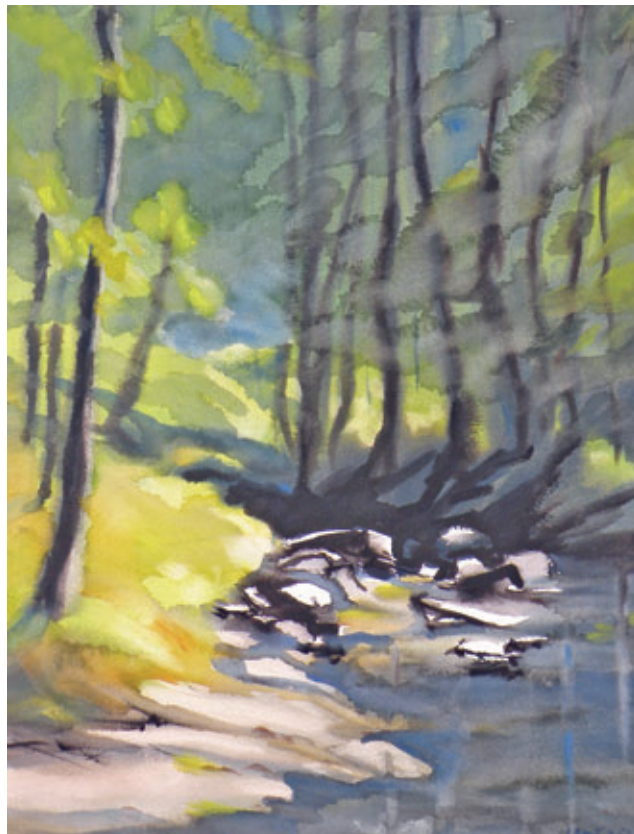
Weißeritz an der Stübemühle 44 x 57 cm