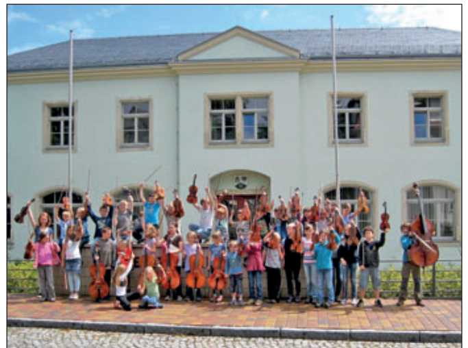
Das Bürgerhaus Bannewitz ist der Hauptsitz der Musik-, Tanz- und Kunstschule Bannewitz.

Musik-, Tanz- und Kunstschule Bannewitz - Mitglied im Verband deutscher Musikschulen -