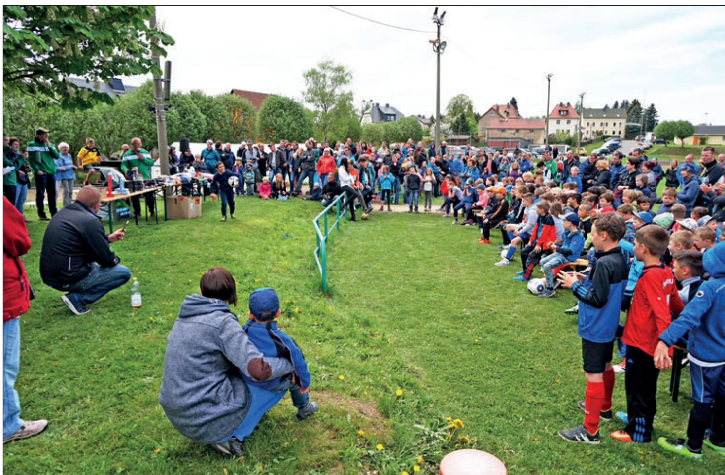
Siegerehrung des Schülerturniers